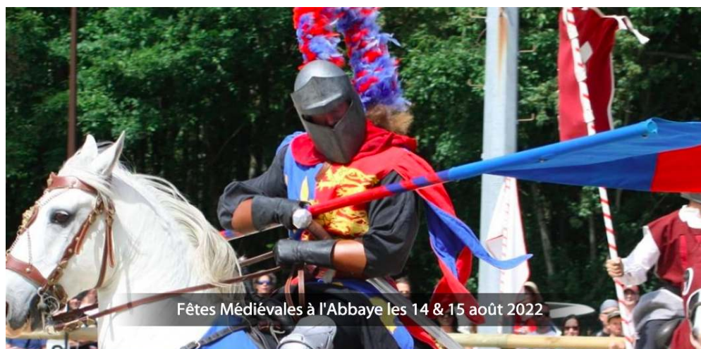
Fêtes Médiévales à l'Abbaye les 14 & 15 août 2022